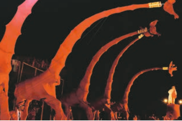
Giraffen van Compagnie Off.